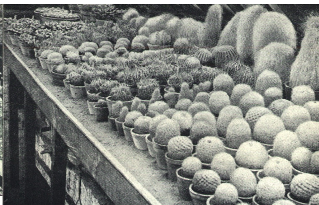
Obr. 241. Importované kaktusy z Mexika.

Ukázka úlovků O. Smrže z popisované výpravy za ilustracemi pro jeho knihu