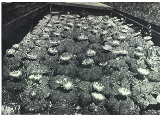
Obr. 231. Vykvétající Acrophytum asterias v pařeništi.

Kniha vyšla v roce 1929 s předmlouvou Karla Čapka. Reakce na vydání tohoto bezesporu ve své době moderního a dodnes inspirativního díla byla na rozdíl od názoru autora velice příznivá; za všechny citujme A. V. Friče: „Kniha o kaktusech jest nádherná a nevyrovnej se jí žádná díla cizozemská, byť měla barevné přílohy. Měl jsem z ní velkou radost“.