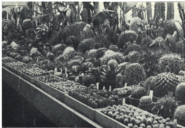
Titulní strana Seitzova katalogu